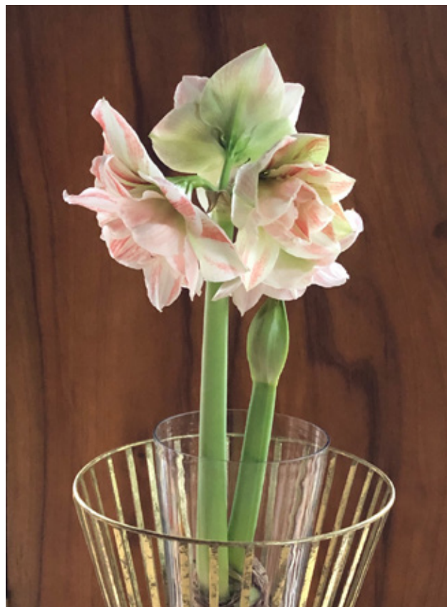
'Kerk en diaconie, twee bloemen uit één bol' (een van onze gesprekspartners)

Wij zijn van mening dat kerkenraden, colleges van diakenen en colleges van kerkrentmeesters, in het hiervoor genoemde gezamenlijke proces van beleidsvorming, zouden moeten nagaan of er in het geheel van de activiteiten die in het verleden door de kerk werden betaald elementen zijn die (geheel of gedeeltelijk) een diaconaal karakter hebben en die derhalve mede gefinancierd zouden kunnen worden door de diaconie. Dat kunnen taken zijn die een predikant uitvoert, bijvoorbeeld het pastoraat voor mensen met een beperking, maar er kan uiteraard breder worden gekeken. Een en ander geldt uiteraard ook omgekeerd.