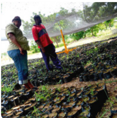
→ Binnenkort worden deze notenboomstekjes uitgeplant

'Het verwerken van de noten kost nu minder tijd en brandhout'