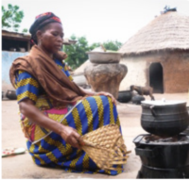
→ De gestampde kariténoten worden urenlang gekookt

Midden op het erf van Azara staat een grote, tot de rand toe gevulde pan te pruttelen boven een houtvuurtje. Niets wijst erop dat Azara hier de grondstof maakt voor schoonheidscrèmes die bij ons in de winkel liggen. Tot voor kort kreeg Azara maar een paar cent voor haar product. Dankzij de Ghanese Kerk en dankzij uw ondersteuning via Kerk in Actie is dat nu anders.