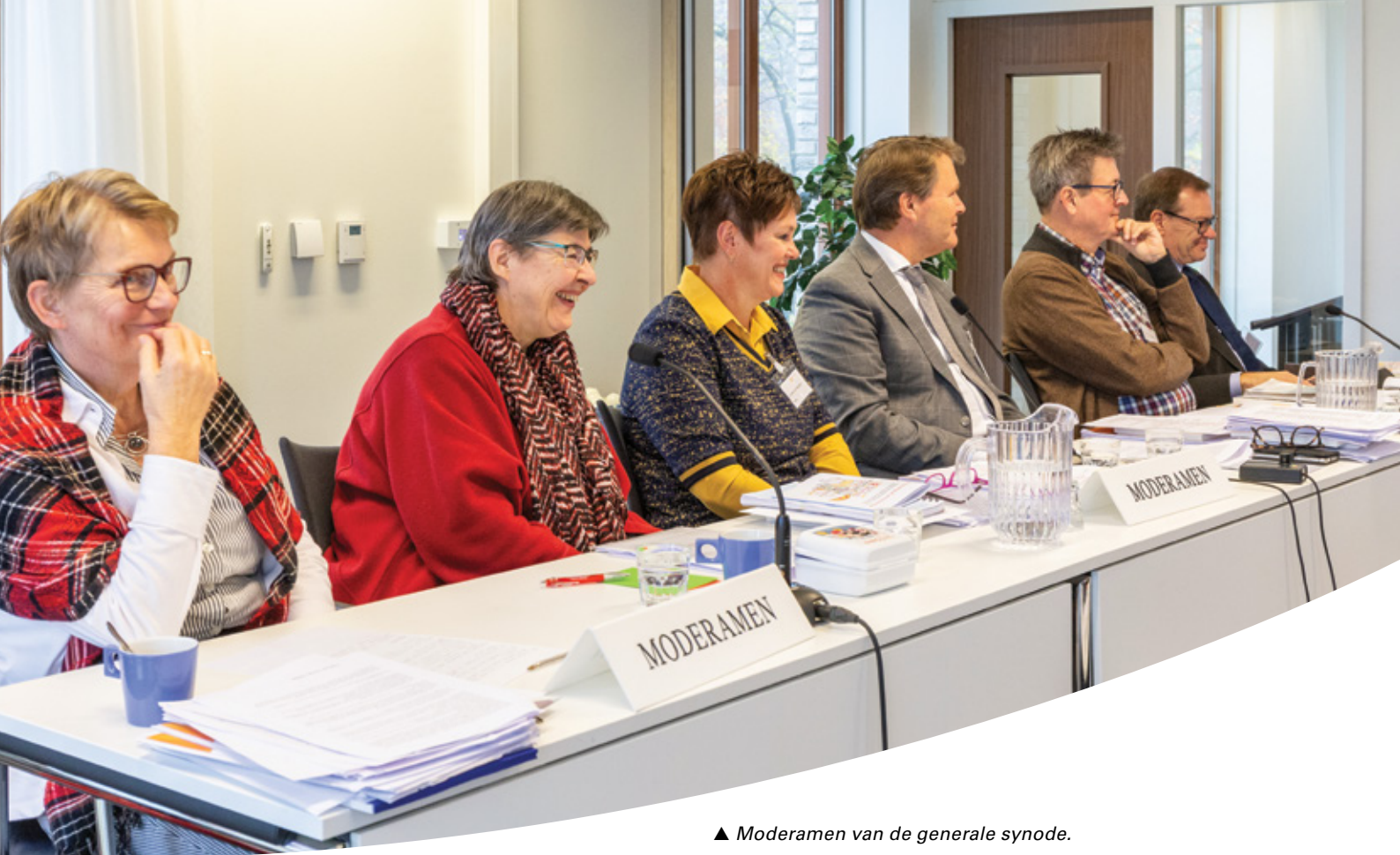
▲ Moderamen van de generale synode.