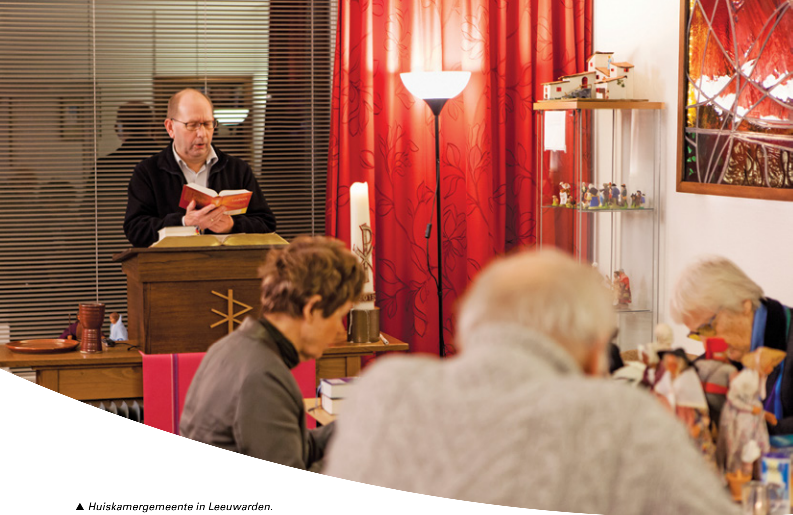
▲ Huiskamergemeente in Leeuwarden.